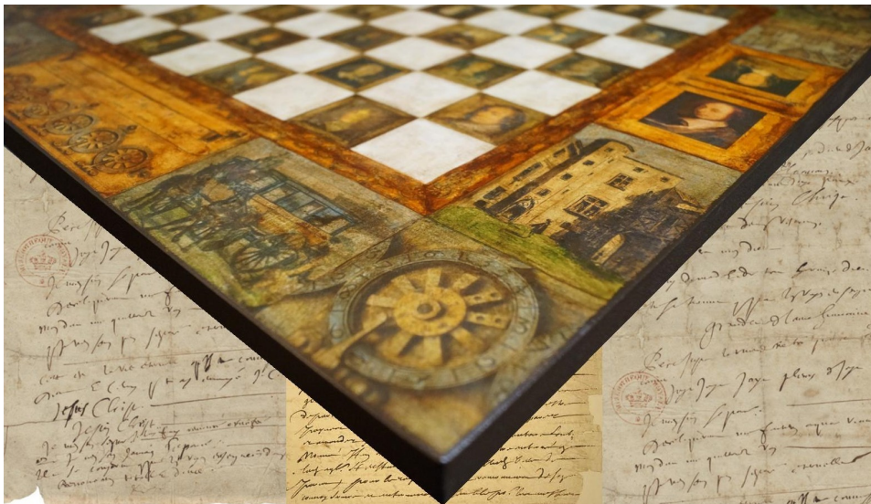
Les échiquiers pascaliens

« Quelles sont les probabilités pour que Blaise Pascal ait joué aux échecs ? »