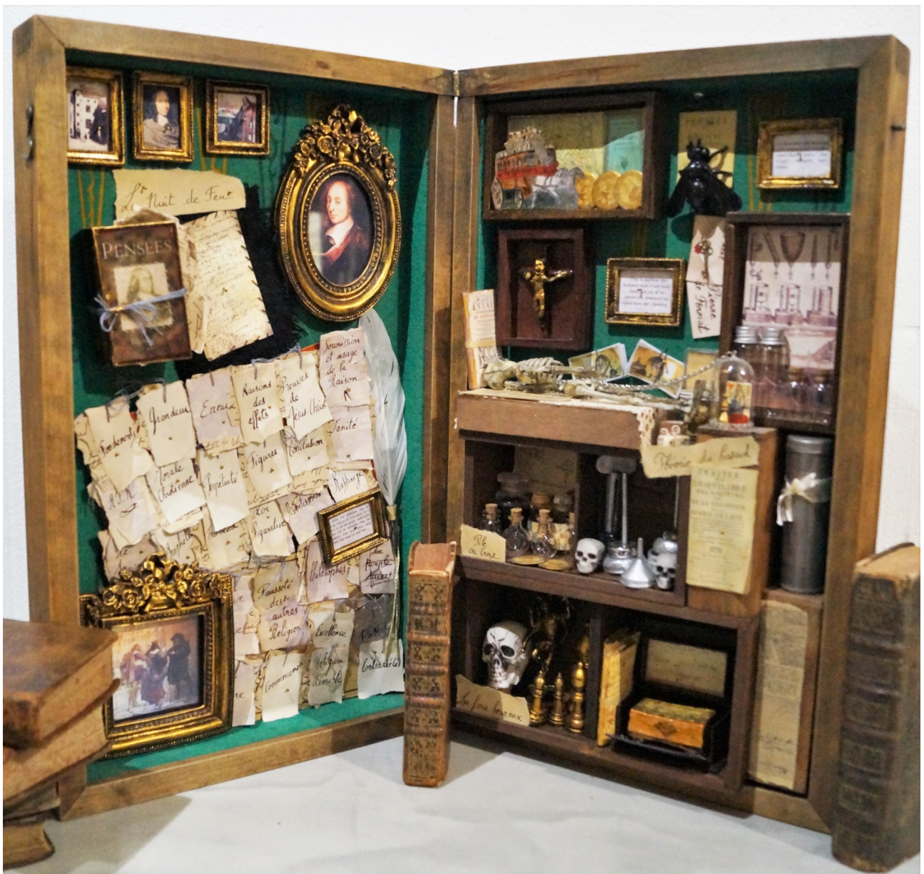
Le Cabinet de Curiosités de Blaise Pascal

« Quelles sont les probabilités pour que Blaise Pascal ait joué aux échecs ? »