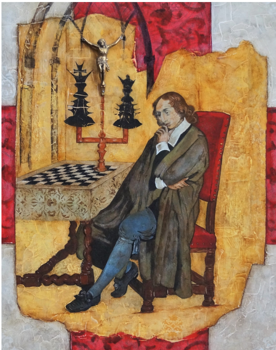
tableau « Le Pari » - détail

« Quelles sont les probabilités pour que Blaise Pascal ait joué aux échecs ? »